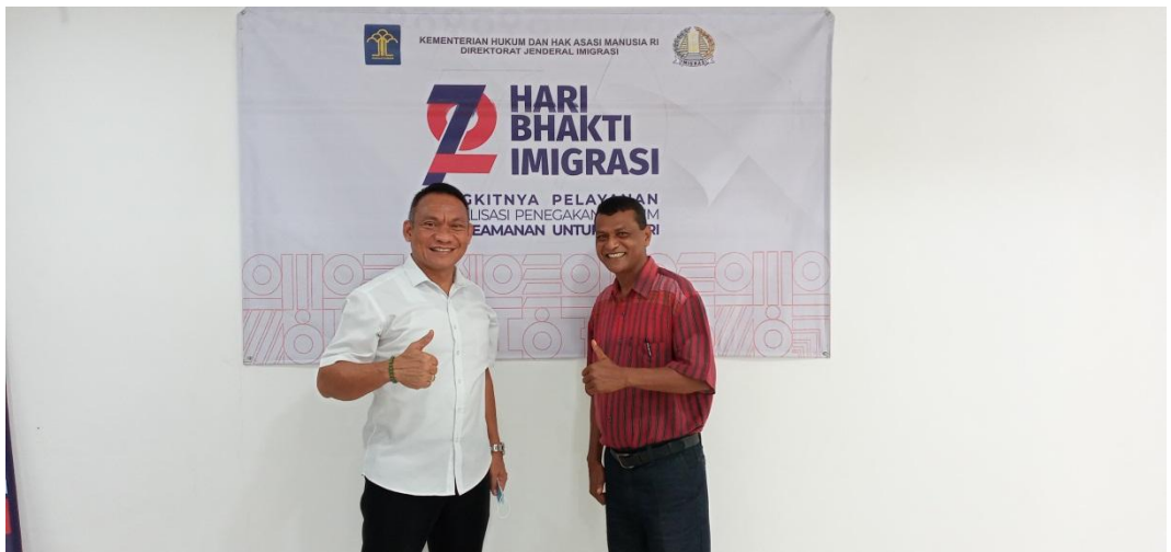
Intervista ho Atase Imigrasaun Indonesia iha Dili