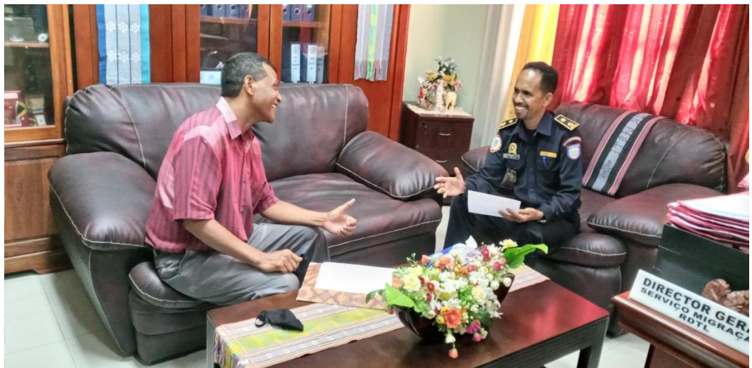
Intervista ho Sr. Diretor Migrasaun Dili, Timor-Leste