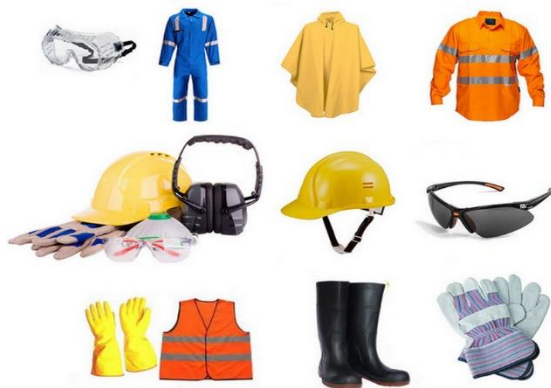
Gambar 1.6, Alat pelindung diri

Alat pelindung diri yang kadaluwarsa/kedaluwarsa yang mengandung unsur berbahaya tersebut harus dimusnahkan sesuai dengan hukum dan peraturan setempat. Setiap karyawan harus menjaga kesehatan pribadinya agar dapat beroperasi secara efisien dan efektif. Apalagi ketika tuntutan kerja sangat tinggi, beban kerja karyawan seringkali melebihi tingkat yang diharapkan, yaitu lembur.